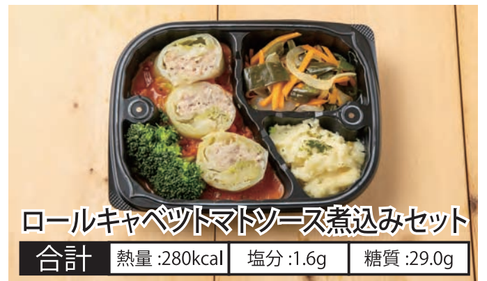
ロールキャベツトマトソース煮込みセット 合計 熱量:280kcal 塩分:1.6g 糖質:29.0g