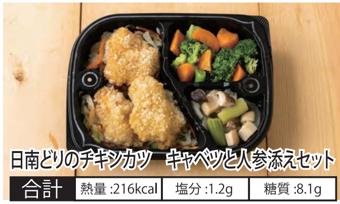
日南どりのチキンカツ キャベツと人参添えセット 合計 熱量:216kcal 塩分:1.2g 糖質:8.1g