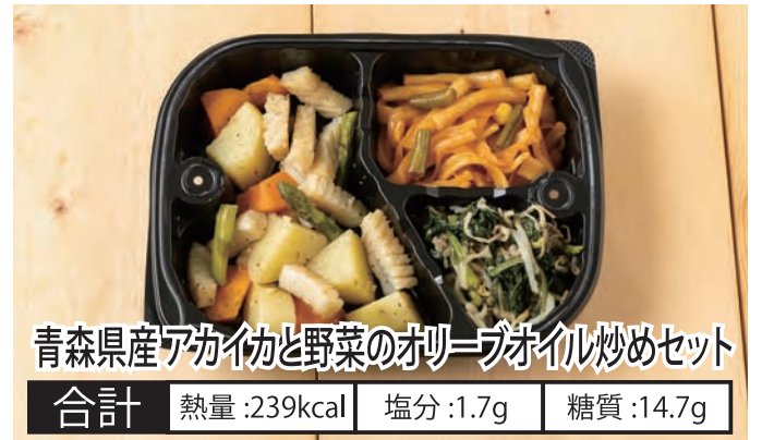
青森県産アカイカと野菜のオリーブオイル炒めセット 合計 熱量:239kcal 塩分:1.7g 糖質:14.7g