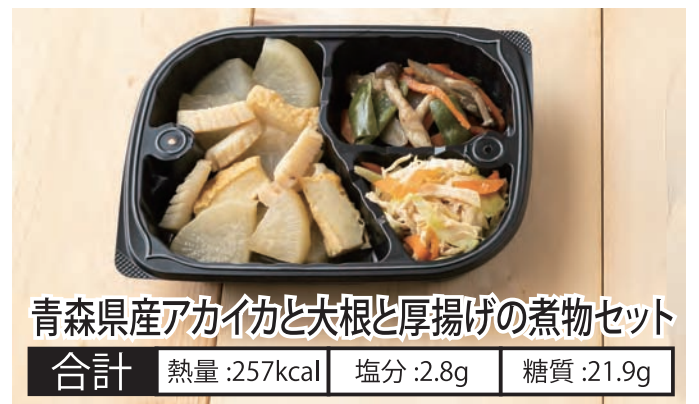
青森県産アカイカと大根と厚揚げの煮物セット 合計 熱量:257kcal 塩分:2.8g 糖質:21.9g