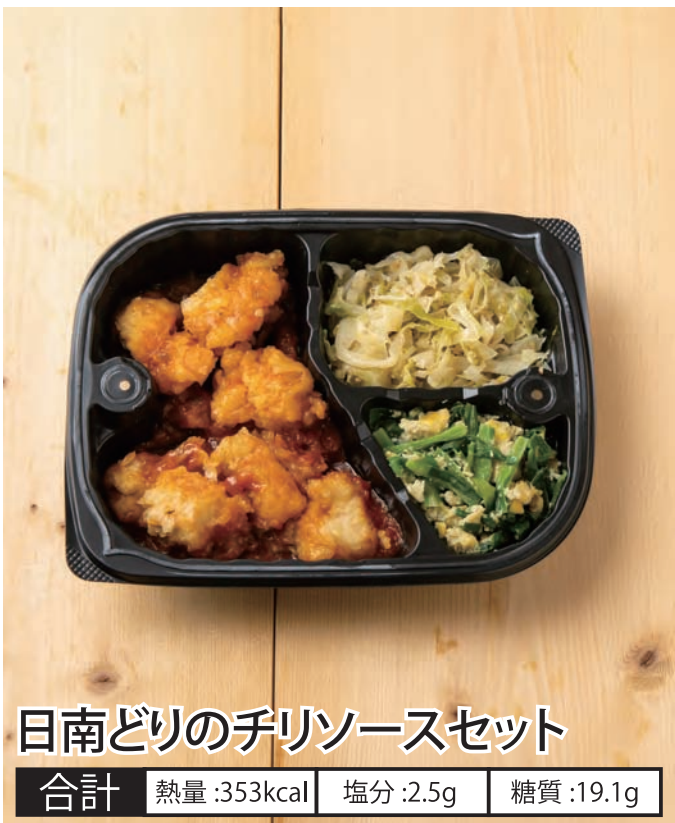
日南どりのチリソースセット 合計 熱量:353kcal 塩分:2.5g 糖質:19.1g