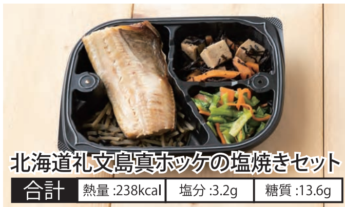
北海道礼文島真ホッケの塩焼きセット 合計 熱量:238kcal 塩分:3.2g 糖質:13.6g