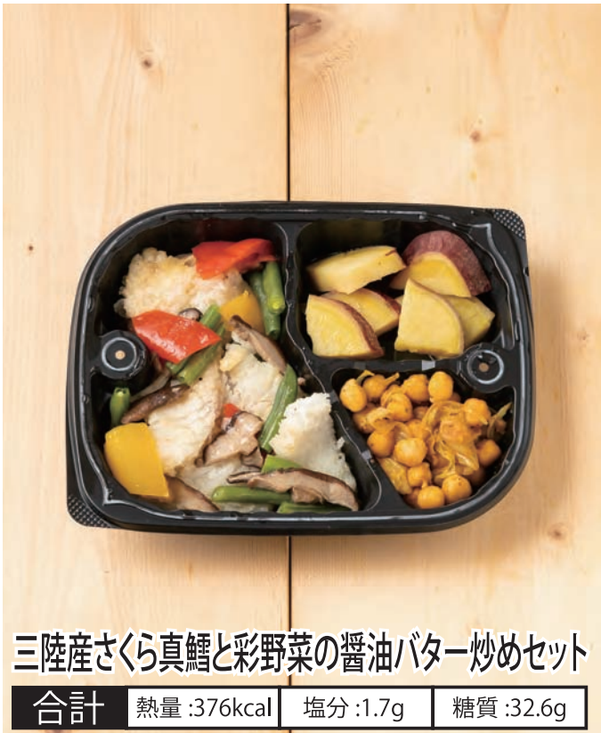
三陸産さくら真鱈と彩野菜の醤油バター炒めセット 合計 熱量:376kcal 塩分:1.7g 糖質:32.6g