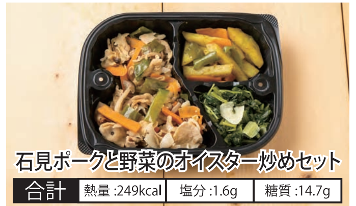
石見ポークと野菜のオイスター炒めセット 合計 熱量:249kcal 塩分:1.6g 糖質:14.7g