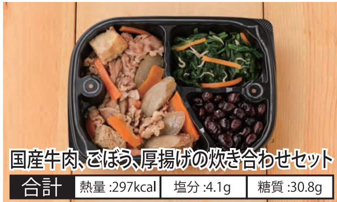
国産牛肉、ひばう、厚揚げの炊き合わせセット 合計 熱量:297kcal 塩分:4.1g 糖質:30.8g