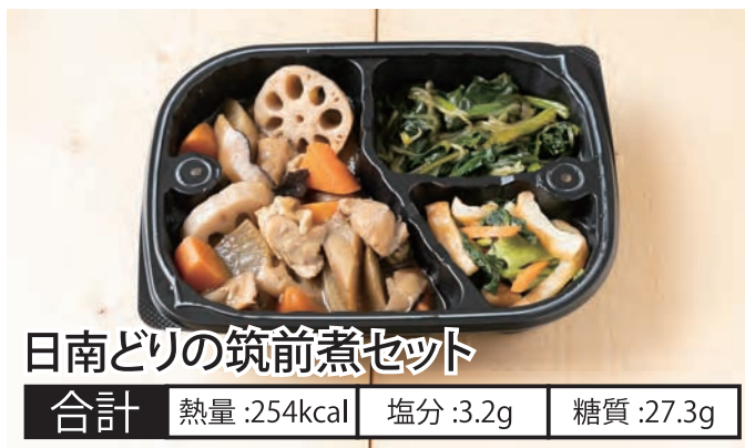
日南どりの筑前煮セット 合計 熱量:254kcal 塩分:3.2g 糖質:27.3g